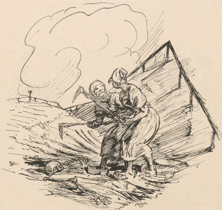
Madame Beudet lächelt / Von André Obeý

Madame Beudet hatte ihren Mann nicht lieb. Madame Beudet glaubte sich für Liebe bestimmt. Madame Beudet hatte fünfunddreißig Jahre hinter sich, zwölf Jahre unedeligen Ehelebens, und sie hatte drei Kinder. Madame Beudet lächelte immer. Man kann sich das zurechtlegen wie man will.