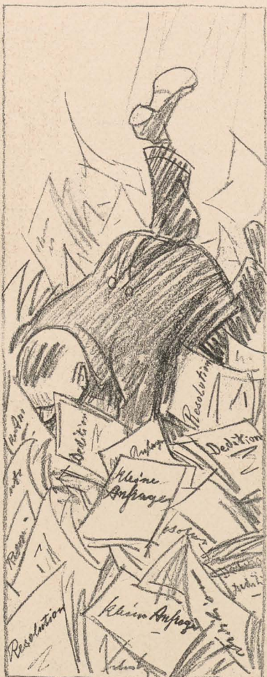
kehrt er zu seinem Element zurück.