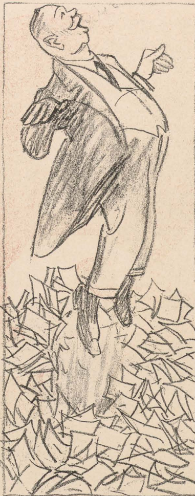
Aus Papier geboren —