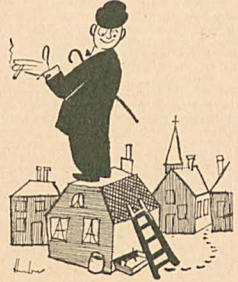
„Nerkenübel — Jedemal, wenn ich eine Rosenkavalier rauche, verlaufe ich mich.“