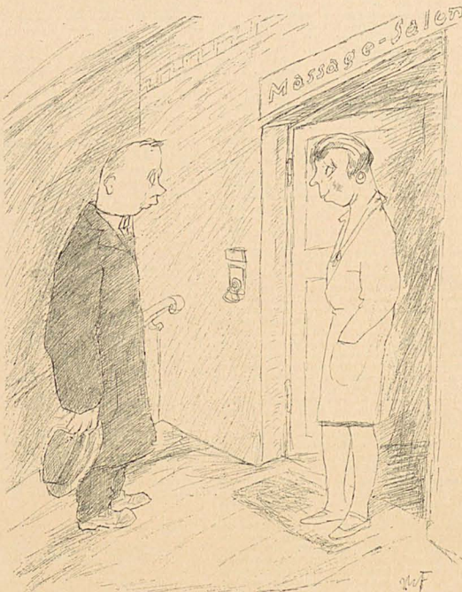
„Wat?! Bloß studienhalber kommen Sie zu uns? Da sind Sie hier falsch. Das Mädchenjnasium ist gleich um die Ecke.“