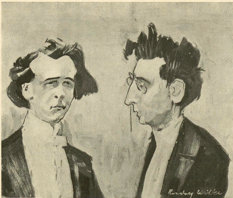
„Eine Schöpfung des Meisters steht nicht ganz auf der Höhe: sein Sohn.“