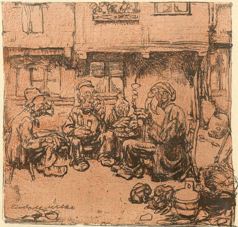
„Das Arbeiten is 'n dazigte Sat. Da bliesst und gar fern betten Tied, über uns' flechte Nag' natogrübelen.“